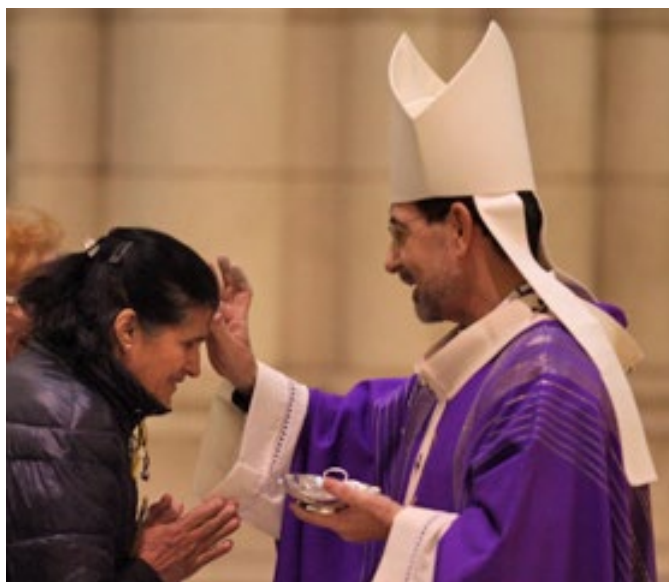
«Este tiempo bien puede ser una respuesta concreta a la propuesta de convertirnos, quizá un poco más, a la Esperanza»

El cardenal Cobo ha subrayado que la Cuaresma es una preparación para la Pascua y ha planteado una se-