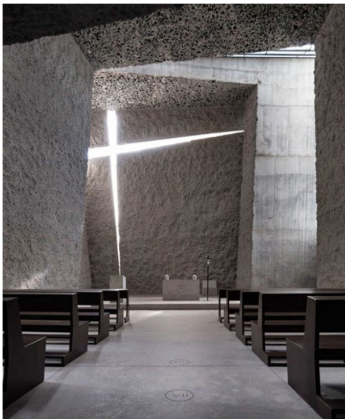
Interior de la Iglesia y Centro Comunitario del Santísimo Redentor, proyecto del arquitecto canario Fernando Menis que ha ganado el World Architecture Festival al mejor edificio del mundo.

El Informe España 2025, presentado en Comillas y que aborda cuestiones como la política o las migraciones, documenta la secularización. El 60% de los jóvenes se declara sin religión.