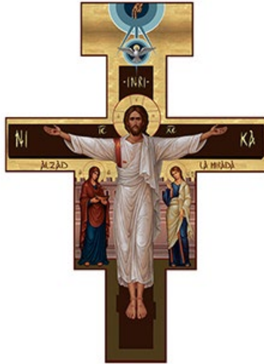
La cruz representa a Jesús resucitado, al Padre y al Espíritu Santo, a María con la barca de la Iglesia y a san Juan.

Esta idea fue tomando forma y se decidió utilizar una cruz diferente a la Cruz Joven que acompaña todas las