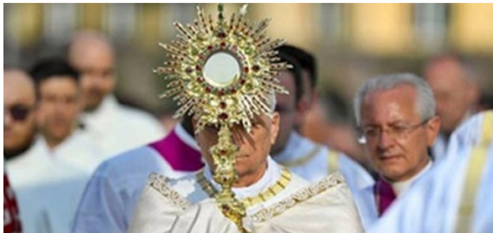
Había pasado poco más de un mes desde su elección como Papa, cuando León XIV presidió por las calles de Roma la procesión de Corpus Christi.