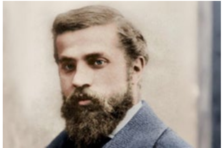
Antonio Gaudí en su plenitud de fuerzas; sus últimos años fueron de vida austera, devota y santa, murió con 73 años, atropellado

Había pedido a Dios morir como un pobre, y murió con 73 años, atropellado por un tranvía: uno le golpeó cuando intentaba esquivar otro. El golpe lo dejó aturdido y puesto que iba sin documentación y con sus ropas viejas y desaliñadas, lo tomaron por un mendigo. Nadie le asistió, ni los transeúntes ni el conductor del tranvía. En sus bolsillos solamente llevaba un rosario y un libro con la interpretación de los evangelios. Tardaron mucho en asistirlo. ¡Tres taxis, o más, se negaron a detenerse para ayudar a transportarlo! Por la acción de un Guardia Civil, finalmente lo llevaron a un hospital de pobres, confundiéndolo con un vagabundo y murió allí 3 días después, el 10 de junio.