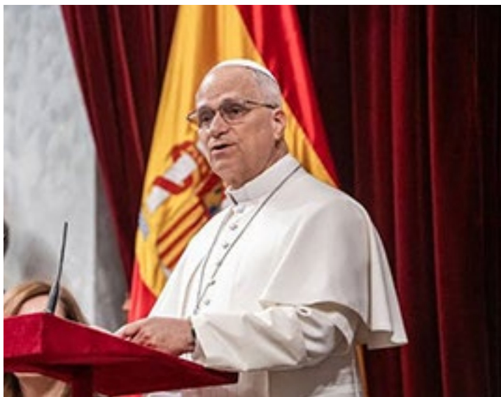
Su Santidad León XIV durante el discurso que pronunció en el Congreso de los diputados.

El Papa ha recordado que la caridad cristiana no admite acepción de personas; pero ha reconocido que «el deber de un Estado de proteger sus fronteras debe equilibrarse con la obligación moral de proporcionar refugio».